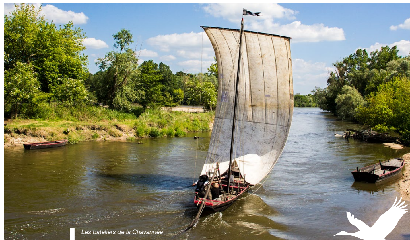
Les bateliers de la Chavannée