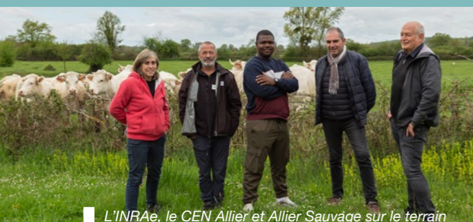
L'INRAE, le CEN Allier et Allier Sauvage sur le terrain

FAIRE DU SITE UNE RÉFÉRENCE reproductible pour lancer une dynamique de conservation conviviale sur l'ensemble du Val d'Allier Nord, en accord avec les trois régions concernées et les acteurs locaux (2029).