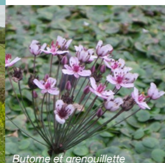
Butome et grenouillette